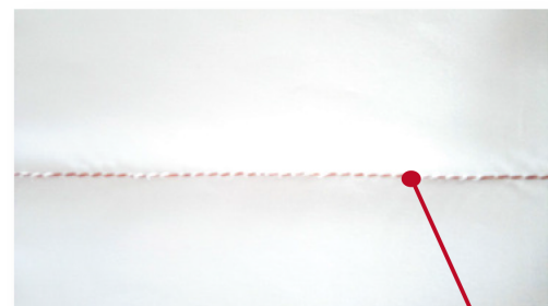
Hilo de Cobre